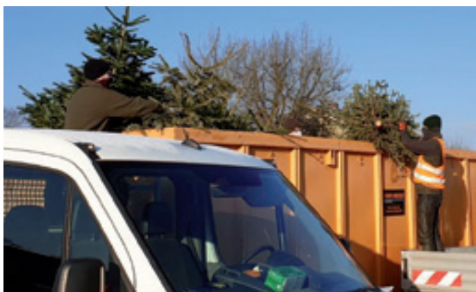
Mit Abstand eine gute Tat: Die Reichenberger Pfadfinder sammelten coronagerecht die ausgedienten Christbäume in Containern.

Das Hygienekonzept der Pfadfinder überzeugte: Um Kontakte zu beschränken, verteilten sich die Helfer in Zweier-Gruppen auf Fahrzeuge, die die Reichenberger Bauunternehmung zur Verfügung gestellt hatte. Für die Geldspenden läuteten die Pfadfinder dieses Jahr allerdings nicht an den Haustüren. Stattdessen bitten