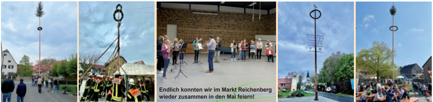
Endlich konnten wir im Markt Reichenberg wieder zusammen in den Mai feiern!